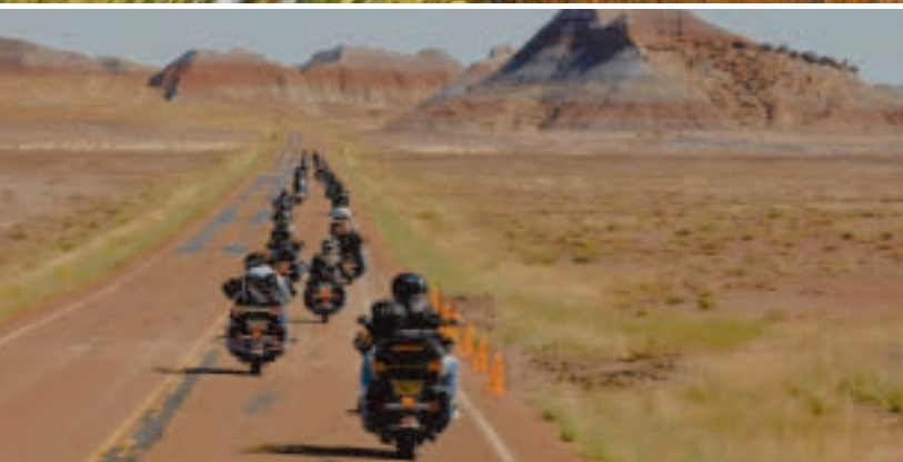
Get your motor runnin' Head out on the highway Lookin' for adventure And whatever comes our way ...