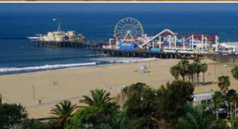
Die letzten Meilen der Route 66 lösen sich am Santa Monica Pier in Wohlgefallen auf.

Rast besuchen Sie die alte, spanische Missionskirche, die sofort Assoziationen an Westernfilme auslösen. Am Abend erreichen Sie Gallup und gehen auf Tuchfühlung mit Hollywood. Im Hotel El Rancho in Gallup logierten schon Filmstars wie Humphrey Bogard oder Gregory Peck.