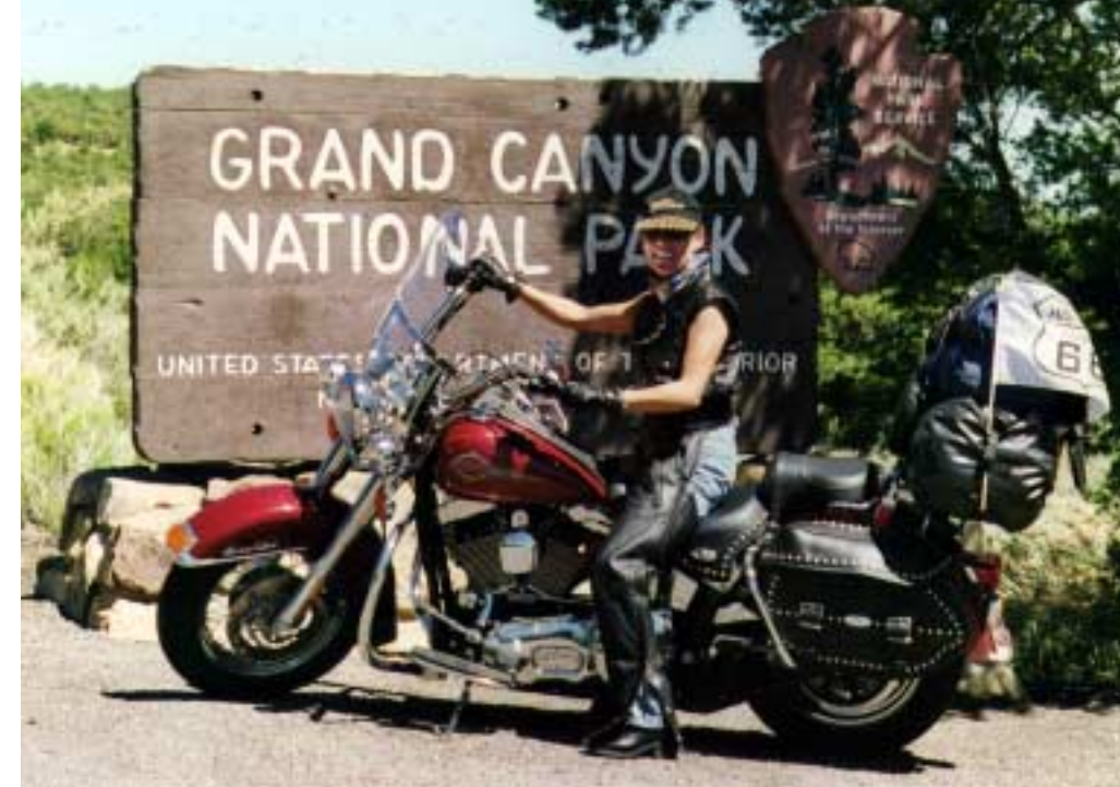
Wie wär's? Sie, das Schild und eine Harley als Fotomotiv im Mai 2004?