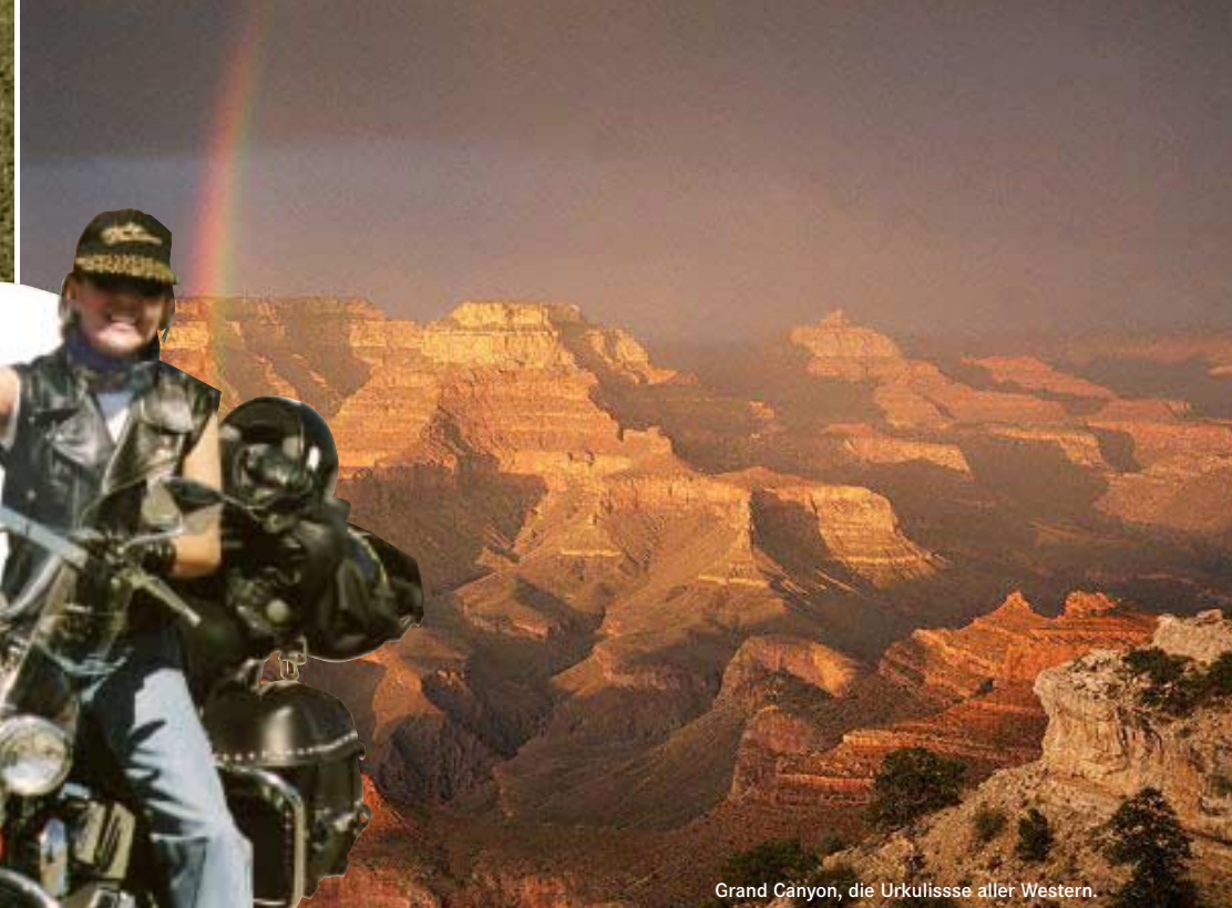
Grand Canyon, die Urkulisse aller Western.