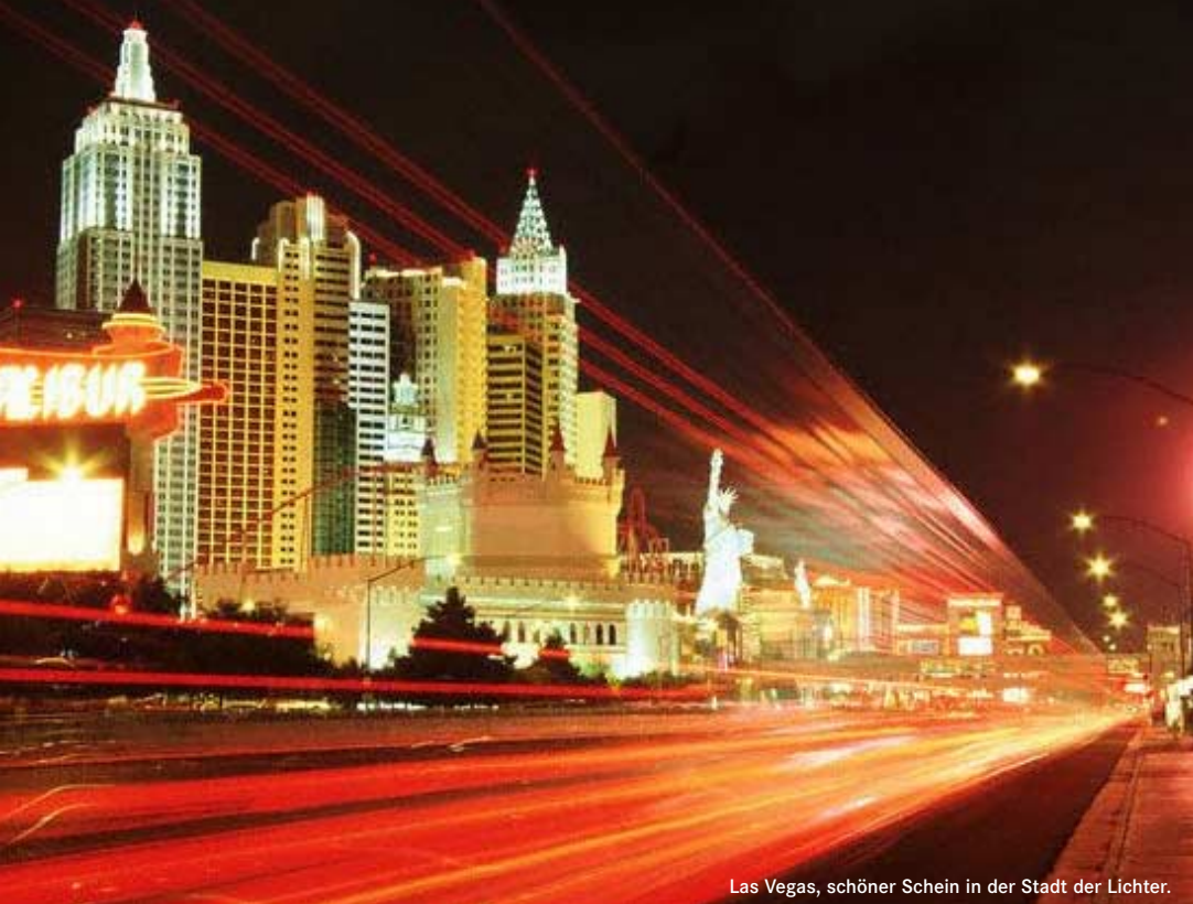
Las Vegas, schöner Schein in der Stadt der Lichter.