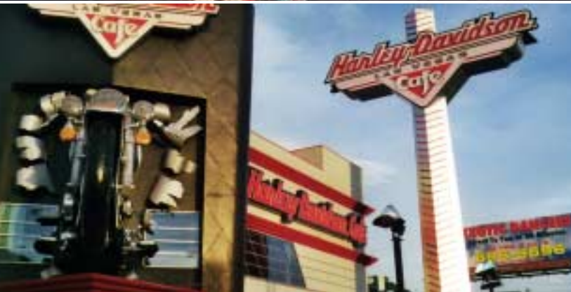
Das Harley Davidson Cafe in Las Vegas für die standesgemäße Tasse Kaffee.